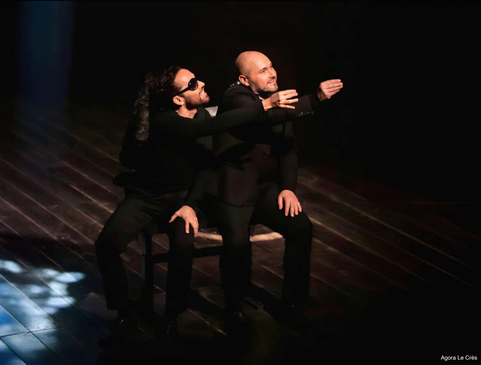
Agora Le Crès